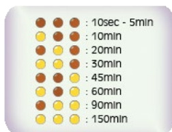
Εικόνα 3 – Πίνακας αντιστοίχισης συνδυασμού ενδεικτικών, με μέγιστο χρόνο συνεχούς ροής (MCFT)